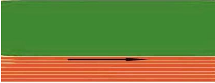
20 m Koşu

ÇABUKLUK VE HIZ TESTİ: Çabukluk ve hız testi yüksek çıkışla başlar. Fotoselle çıkış yapılacağından ayrı bir start uyarısı verilmeyecektir. Sadece o istasyondaki görevli öğretmenin " Hazır olduğunda çıkabilirsin" komutu ile başlayacaktır. Bu testte 2 hak verilecektir. En iyi derece puanlamaya alınacaktır.